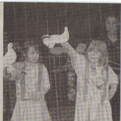
Das Spiel mit den weißen Tauben erforderte viel Geschick.

das andere. Gut 30 Kinder sind bei der akrobatischen Abschluss-Nummer dabei. Einige schlagen Rad – synchron, versteht sich. Andere gehen in den Spagat. Oder sie stellen sich nebeneinander in einer Reihe auf, hinter ihnen steht eine weitere Reihe und