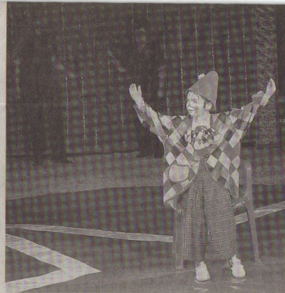
Der große Auftritt des kleinen Clowns hat das Publikum verzaubert.

Kita-Knirpse betreten das Rund, tanzen zur Musik und schwingen rote und gelben Stoffstreifen. So weit, so nett. Doch mit einem Mal wird das Licht gelöscht und nur noch